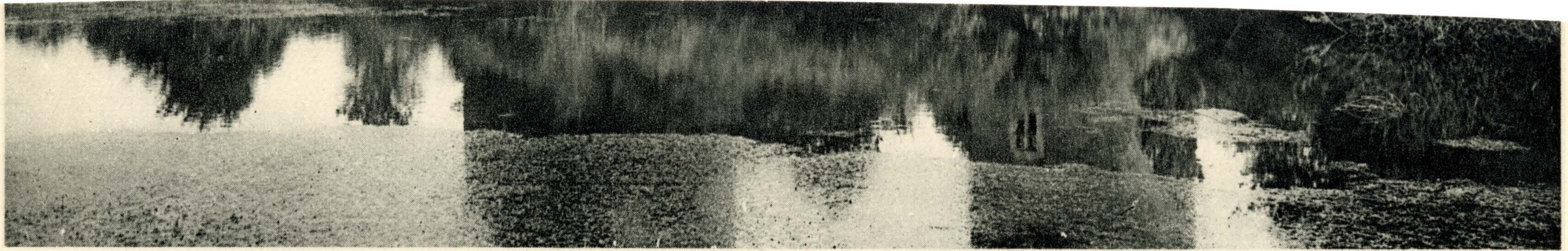
ELVEN (MORBIHAN), FORTERESSE DE LARGOUE LA TOUR DE GAUCHE EST DU XIV e SIÈCLE, CELLE DE DROITE DU XV e (MON. HIST.)